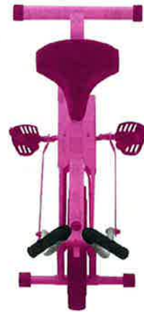
【右ハンドルバーを最も前方に押した状態の正面図】